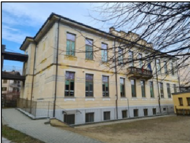
Vista fronte principale -lato sud