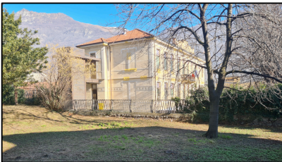
Vista laterale - lato ovest