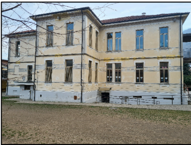
Vista posteriore - lato nord

FOTOGRAFIE AEREE DI INQUADRAMENTO TERRITORIALE